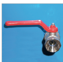
Robinet de vidange 1"