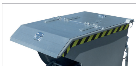
SKM avec couvercle